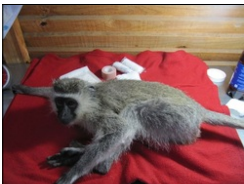
Vervet Monkey Foundation Africa