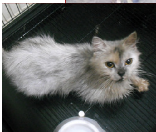
Veulentje Ully die nog sponsors zoekt

Met poes Sugar gaat het helaas niet zo goed!